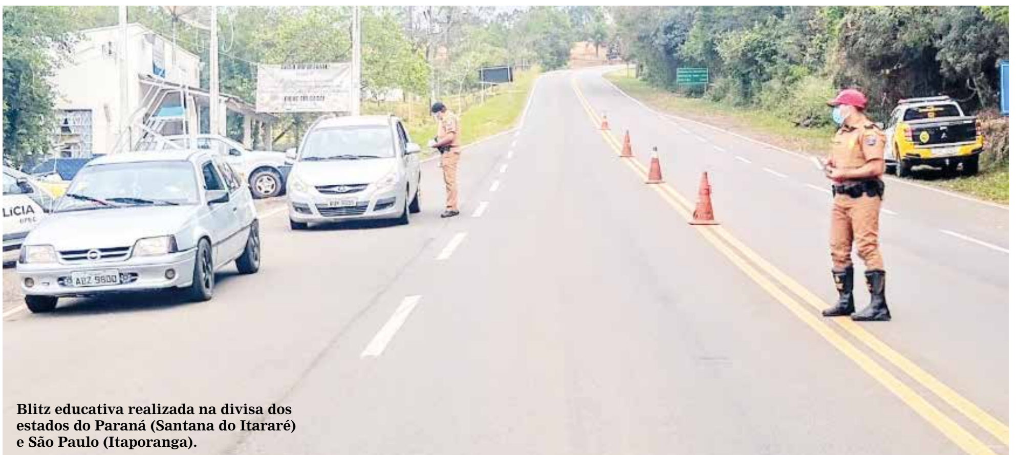
Blitz educativa realizada na divisa dos estados do Paraná (Santana do Itararé) e São Paulo (Itaporanga).

De acordo com a equipe do Batalhão da Polícia Rodoviária Estadual, as ações seguem sendo realizadas até a sexta-feira (25) em diferentes rodovias no Norte Pioneiro e demais regiões do estado seguindo o objetivo de orientar e conscientizar os motoristas sobre os cuidados e riscos do trânsito. Ainda segundo o BPRE, as ações têm sido bem recebidas e elogiadas pela população, motoristas, passageiros e pedestres.